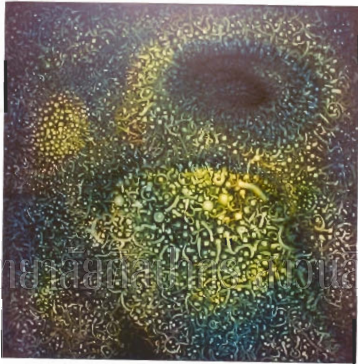
ภาพที่ 6 : ภาพผลงานวิทยานิพนธ์

ชื่อภาพ การเกิด-ดับ ขนาด 2.00 ซม.×2.00 ซม. เทคนิคสีน้ำมัน