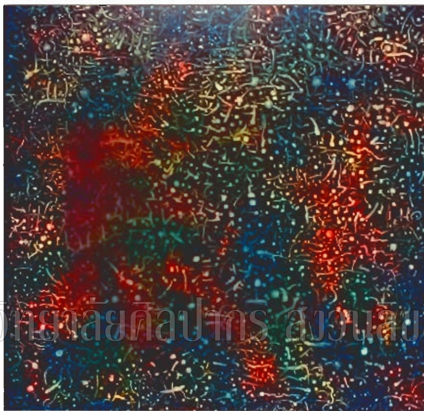
ภาพที่ 4 : ภาพผลงานวิทยานิพนธ์

ชื่อภาพ การเกิด-ดับ ขนาด 2.00 ซม.×2.00 ซม. เทคนิคสีน้ำมัน