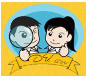
ภาพที่ 1. โครงการ อย. น้อย

โรงเรียน และทำกิจกรรม อย.น้อย จังหวัดละ 5 โรงเรียน จากนั้นในปี 2547 ได้ขยายกิจกรรม ให้ครอบคลุม โรงเรียนระดับมัธยมศึกษาทั่วประเทศ ทั้งโรงเรียนในสังกัดสำนักงานคณะกรรมการการศึกษาขั้นพื้นฐาน (สพฐ.) โรงเรียนเอกชน และโรงเรียนในสังกัดกรุงเทพมหานคร รวม 10,256 โรงเรียน มีสมาชิกมากกว่า 1 ล้านคน