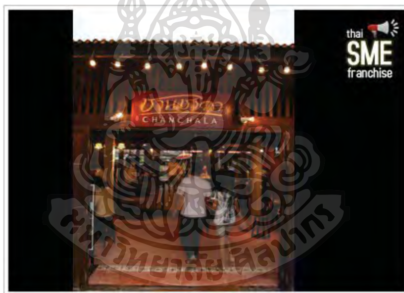
ภาพที่ 2 ร้านกาแฟชานชالا

ด้วยเหตุผลดังกล่าว ทำให้ โครงการฯ ต้องคำนึงถึงผลกระทบภายนอกและภายใน เนื่องจากโครงการเป็นโครงการเพื่อการอนุรักษ์และพัฒนา ยกตัวอย่างเช่น