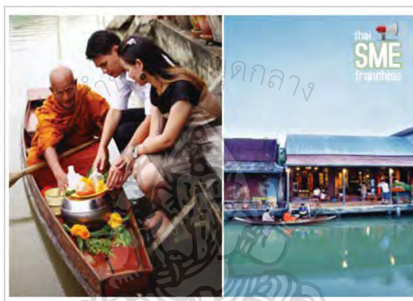
ภาพที่ 8 ตักบาตรยามเช้า

เมื่อพิจารณาจากปัจจัยดังกล่าวแล้ว เนื่องจากโครงการฯ เป็นโครงการเพื่อการพัฒนา แต่ไม่สามารถยื่นหยัดได้ด้วยตนเอง ต้องอาศัยองค์ประกอบร่วมหรือปัจจัยที่มีส่วนเกี่ยวข้อง จึงจะทำให้โครงการฯ พัฒนาไปได้อย่างยั่งยืน ด้วยความร่วมมือของชุมชนทุกฝ่ายที่มีส่วนร่วมร่วมกัน