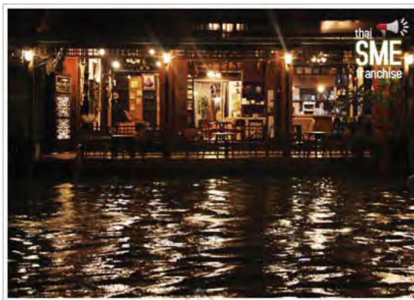
ภาพที่ 7 ริมหคลองตลาดน้ำอัมพวา ตกแต่งสไตล์ไทยร่วมสมัย

เจ้าของรีสอร์ท เผยด้วยว่า แม้จะปรับรูปแบบและบริการให้ได้มาตรฐานระดับสูง แต่สิ่งสำคัญเหนืออื่นใด คือ ยังคงเอกลักษณ์ของความเป็นอัมพวา ทั้งด้านสถาปัตยกรรมพยายามรักษาโครงสร้างหลักดั้งเดิมไว้ให้มากที่สุด ของตกแต่งต่างๆ ส่วนใหญ่เป็นของเก่าแท้ หรือของใหม่ที่เข้ากันได้ดีกับสภาพแวดล้อม รวมถึง บริการที่สอดคล้องวิถีชุมชน เช่น ปิดประตูรีสอร์ทเวลา 5 ทุ่มเท่านั้น เพื่อรักษาความเงียบสงบ ผลิตภัณฑ์ต่างๆที่ใช้ในรีสอร์ท เน้นเป็นมิตรกับสิ่งแวดล้อม พร้อมจัดกิจกรรมเหมาะสมกับวิถีชีวิตชาวบ้าน เช่น ใสบาตรตอนเช้า ล่องเรือดูหิ่งห้อย พาไหว้พระ บริการนวดแผนไทย อาหารท้องถิ่น และปฏิบัติธรรม เป็นต้น