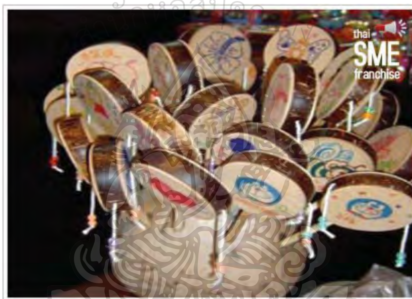
ภาพที่ 4 ของเล่นไทยในอดีต

ภาพของหมากฝรั่งม้วนบุหรี ลูกสมอ มะนาว ยังอยู่ในความทรงจำของใครหลายคน แม้ว่าขนมโบราณที่เคยเห็นในวัยเด็กอาจกลายเป็นของหายาก แต่ในงานสุดยอดหมู่บ้านอุตสาหกรรมและผ้าทอไทย ครั้งที่ 4 ที่จะมีไปถึงวันที่ 6 พ.ย.นี้ ณ เมืองทองธานี ได้จำลองชีวิตชุมชนตลาดน้ำอัมพวา และหนึ่งในนั้น เป็นร้านขายขนมในวัยเด็ก ได้รับความสนใจจากผู้เข้าชมงาน มาซื้อนรำลึกถึงภาพเก่าในอดีต ผ่านเรื่องเล่าเกี่ยวกับขนมที่ได้กลับมาเห็นอีกครั้ง