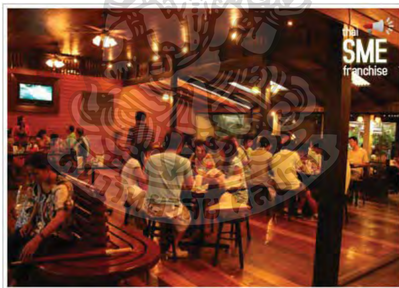
ภาพที่ 3 บรรยากาศภายในร้านกาแฟ

โดยร้านกาแฟดังกล่าวเปิดให้บริการอยู่ด้านหน้าริมคลองอัมพวา พื้นที่ 3 ห้อง ภายในร้านจำหน่ายเครื่องดื่ม อาทิ กาแฟ ชา น้ำผลไม้ปั่น น้ำสมุนไพร น้ำอัดลม น้ำแข็งไส น้ำดื่ม และอาหารว่างประเภท ขนมปังปิ้ง ขนมปังนึ่ง ป๊อปคอร์น ฯลฯ และมีมุมจำหน่ายของที่ระลึกโครงการฯผลิตภัณฑ์ของมูลนิธิชัยพัฒนา ผลิตภัณฑ์ท้องถิ่น และเป็นศูนย์กลางในการเผยแพร่กิจกรรมต่างๆ ภายในโครงการ ข้อมูลแหล่งท่องเที่ยว กิจกรรมของชุมชนอัมพวา มาของซานซาลา ต้องการให้เป็นจุดพัก