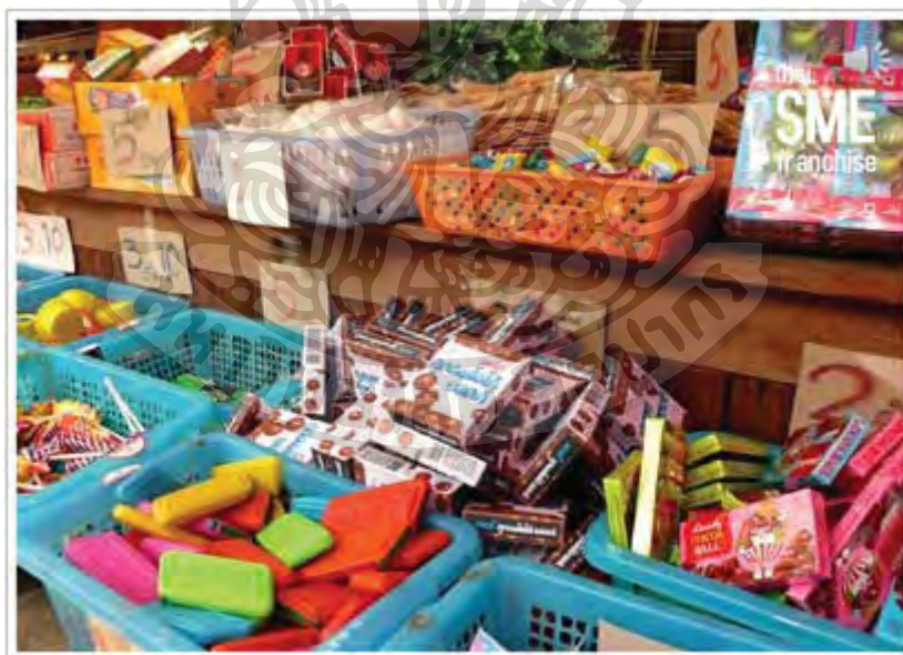
ภาพที่ 5 ขนมย้อนยุค

สำหรับขนมโบราณที่ขายภายในร้าน ประกอบไปด้วย หมากฝรั่งตราแมว ลูกสมอ มะนาว ขนมเหนียว คุกกี้ ตอफीกะทิ ดังเมถุน เป็นต้น และมีของเล่นโบราณ อย่าง ปองแป็งกะลามะพร้าว โดยขนมที่นำมาจำหน่าย จะรับซื้อมาจากพ่อค้าคนกลาง ซึ่งเป็นร้านขายของชำ ภายในชุมชน ซึ่งขายมานานหลายสิบปี โดยไปรับมาจากบริษัทผู้ผลิต ซึ่งเป็นผู้ผลิตรายดั้งเดิมตั้งแต่ในอดีต รสชาติของขนมทุกอย่างยังเหมือนเดิม ไม่มีการปรับเปลี่ยน ทั้งรสชาติภายใน หรือรูปลักษณะภายนอก ส่วนที่เปลี่ยนแปลง มีเพียงราคาที่เพิ่มขึ้น อาทิเช่น หมากฝรั่งกล่องละ 3 บาทถึง 5 บาท ลูกสมอ มะนาวห่อละ 1 บาท ถึง 2 บาท เป็นต้น