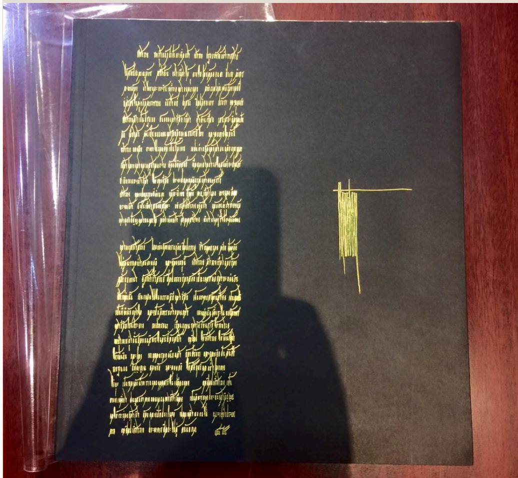
อนุสรณ์ถวัลย์ ดัชนี อนุสรณ์งานศพถวัลย์ ดัชนี ศิลปินแห่งชาติ สาขาทัศนศิลป์ ประจำปีพุทธศักราช 2544