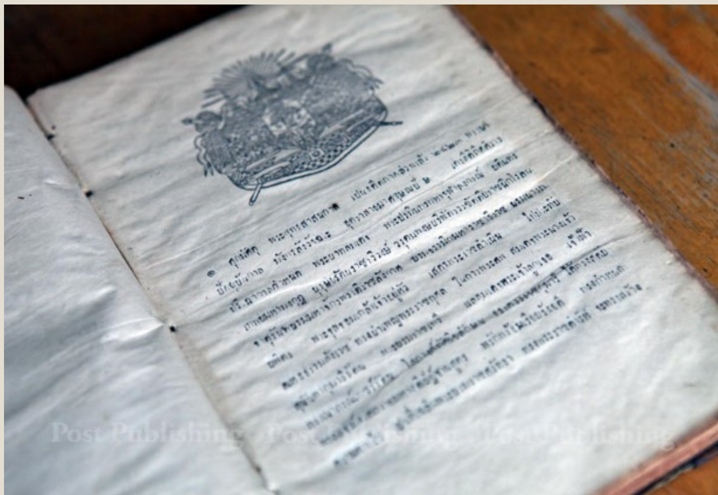
หนังสืออนุสรณ์งานศพในงานพระเมรุสมเด็จพระนางเจ้าสุนันทากุมารีรัตน์ (พระนางเรือล่ม) ถือเป็นหนังสืองานศพเล่มแรกในเมืองไทยเมืองไทย มีความหนา 300 หน้า