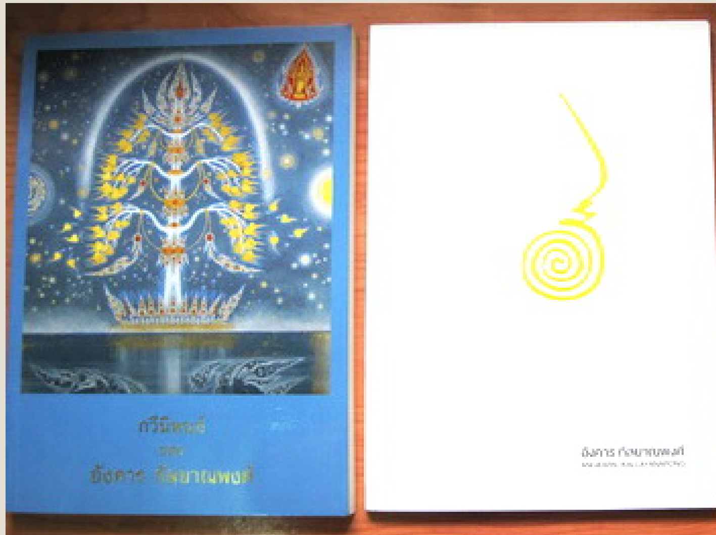
อนุสรณ์งานพระราชทานเพลิงศพ นายอังกาบ กัลยาณพงศ์ ศิลปินแห่งชาติ ตีสาขาวรรณศิลป์ (กวีนิพนธ์)