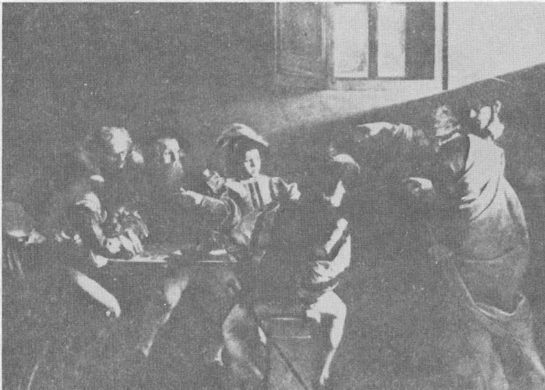
เสียงเรียกจากเซนต์แมทธิว โดยคาราวาจีโอ ราว ค.ศ. 1597 โบสถ์คอนตาเรลลิ โรม