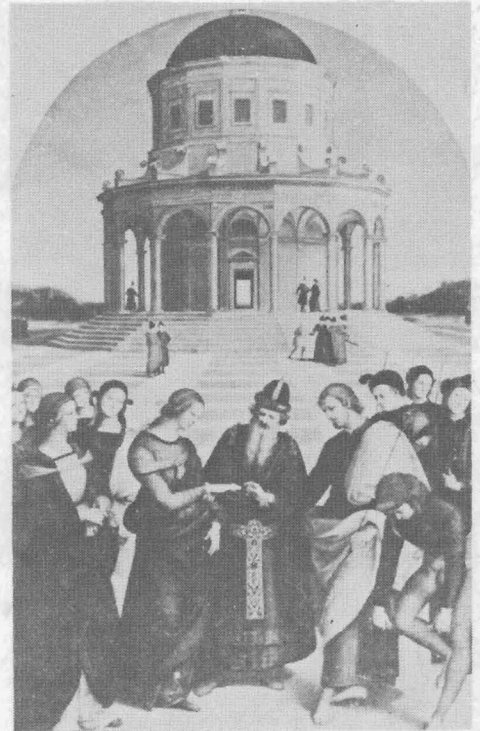
การแต่งงานของพระแม่มารี โดยราฟาเอล ค.ศ. 1504

เป็นจิตรกรชาวอิตาลี ขณะทำงานของไมเคิล แองเจโลแสดงพลังท่วมท้นเหนือคนดูอยู่ด้วยร่าง คนล้วน ๆ นั้น ราฟาเอลกลับทำให้ภาพของตนมี อากาศ มีพื้นที่ ด้วยการจัดทัศนียภาพและวางองค์ ประกอบศิลป์ที่ขัดเกลาธรรมชาติให้นุ่มนวลงดงาม ตามแบบอุดมคติ สิ่งที่น่าสังเกตสำหรับราฟาเอลก็ คือ การจัดองค์ประกอบให้เป็นทรงพีระมิด