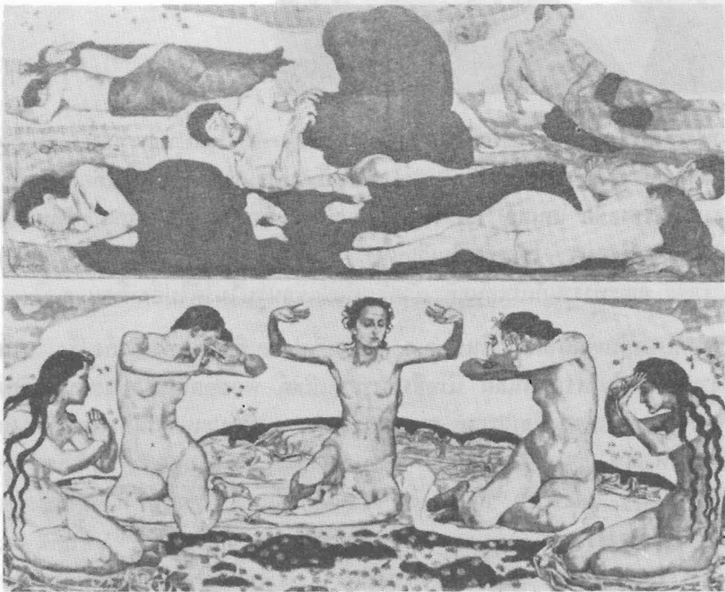
(ภาพบน) ภาพราตรี ค.ศ. 1890 ภาพสีน้ำมัน ขนาด 45\frac{3}{4} \times 119 " พิพิธภัณฑ์ศิลปะเบอร์ลิน (ภาพล่าง) ภาพทิวา ค.ศ. 1900 ภาพสีน้ำมัน ขนาด 63 \times 135 " พิพิธภัณฑ์ศิลปะเบอร์ลิน

ในปี ค.ศ. 1890 ภาพ Night ของเขาเป็นที่วิพากษ์วิจารณ์กันในชาลงที่ปารีส เขาถูกคัดค้านอย่างรุนแรงจากนักวิจารณ์ โดยเฉพาะอย่างยิ่ง ภาพที่เขาเตรียมไว้เขียนด้วยสีเฟรสโกที่พิพิธภัณฑ์แห่งเมืองซูริก แต่สุดท้ายภาพนี้ก็เป็นที่ยอมรับใน ค.ศ. 1899 ในประเทศเยอรมันมีผู้ที่ตื่นตื่นสนใจงานของฮ็อดเลอร์อยู่ไม่น้อย ทั้ง ๆ ที่รูปร่างงานของเขาเฉียด ๆ จะเป็นภาพแสดงอารมณ์กระทบใจเขาไปแล้ว เขาได้รับรางวัลเหรียญทองที่มิวนิคใน ค.ศ. 1897 หลังจากนั้นกลุ่ม "Berlin Sezession" ก็รับเขาเป็นสมาชิก ใน ค.ศ. 1899 ที่ "Vienna Sezession" ค.ศ. 1904 ก็มีการแสดงภาพเขียนเพื่อเป็นเกียรติแก่ฮ็อดเลอร์ ภายในเวลาไม่กี่ปีเขาได้รับงานจากทั้งมหาวิทยาลัยเจนาและเทศบาลเมืองซาโนเวอร์ ซึ่งให้เขาเขียนภาพประดับอาคาร ถ้าไม่นับงานตกแต่งพวกนี้แล้ว งานระยะหลัง ๆ ของเขาก็จะเป็นภาพวิญญูเขาแทบทั้งสิ้น ภาพเหล่านี้มีสีสันที่ให้ความรู้สึกและมีการเขียนที่เป็นอิสระจากกฎเกณฑ์ เขาถึงแก่กรรมเมื่อวันที่ 20 พฤษภาคม ค.ศ. 1918