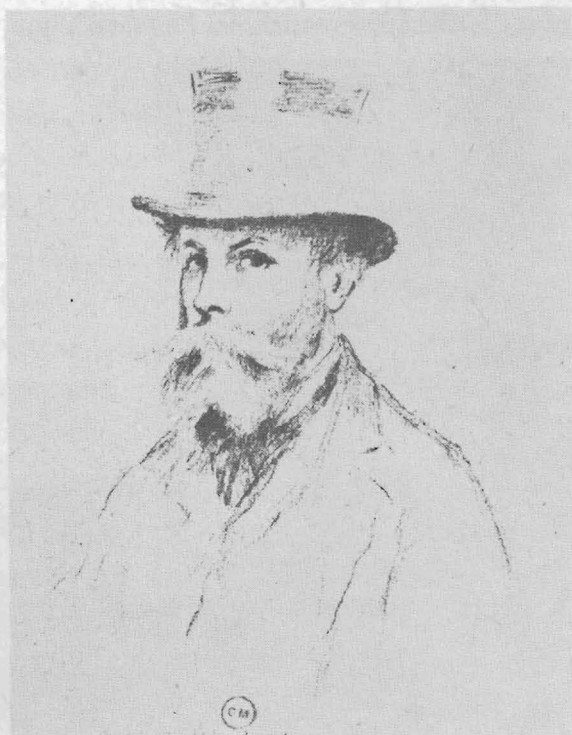
ภาพเขียนตัวเองของมอโร

จิตรกรซิมบอлистต์ผู้มีความคิดฝันอันแพรวพราว