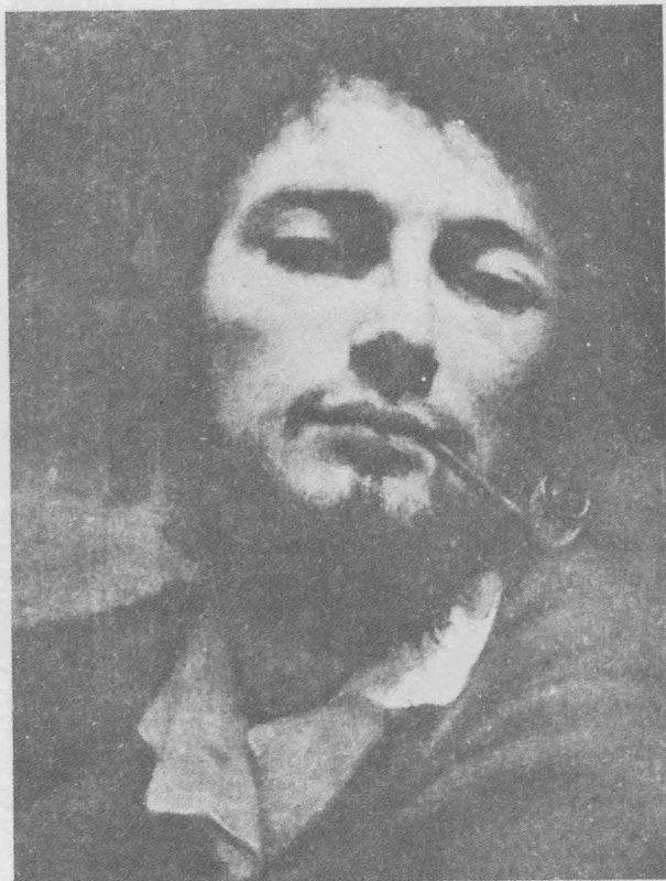
ภาพเขียนตัวเองของกูร์เบต์ “ชายสูบกล้อง”

กุสตาฟ กูร์เบต์ เกิดที่เมืองออร์นองซ์ เมื่อวันที่ 10 มิถุนายน 1819 ในตระกูลชาวนาผู้มั่งคั่ง ปู่ของเขามีความโน้มเอียงไปในทางสาธารณรัฐนิยม ซึ่งมีผลต่อกูร์เบต์มาแต่เยาว์วัย เขามีอุปนิสัยชอบต่อสู้และก็ทำงานศิลปะออกมาในลักษณะนั้น เขาเกลียดการศึกษาศึกษาและคัดค้านการเมืองอย่างรุนแรง สนใจแต่กิจกรรมและการวาดเส้นเท่านั้น เคยศึกษาศิลปะกับศิษย์ของจาคส์ ลุยซ์ ดาวิ ซึ่งสอนให้เขาร่างภาพเหมือนและมุมต่าง ๆ บนท้องถนน