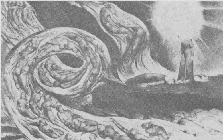
ภาพคู่รักในลมหมอน เป็นภาพประกอบเรื่อง “สุขนาฏกรรมประเสริฐ” โดยเบลค ราว ค.ศ. 1824 สีนากับปากกา และหมึกขนาด 14 \frac{3}{4} " x 20 \frac{7}{8} " พิพิธภัณฑ์ศิลปะเบอร์มิงแฮม อังกฤษ

ค.ศ. 1818 เบลคได้รู้จักกับจิตรกรชื่อ จอห์น ลินเนล ผู้ว่าจ้างให้เบลคผลิตภาพประกอบหนังสือ Book of Job ที่เบลคทำเอาไว้แล้วออกมาอีก 1 ชุด ภาพเหล่านี้ล้วนเป็นเรื่องเกี่ยวกับความทุกข์ทรมานและความโหดร้ายเลวทราม นอกจากนี้ลินเนลยังให้เบลคทำงานชิ้นใหญ่ยิ่งขึ้นสุดท้ายของเขา คือ ภาพประกอบชุด Divine Comedy (สุขนาฏกรรมประเสริฐ) ซึ่งเริ่มทำในปี ค.ศ. 1824 แต่พอถึงปี ค.ศ. 1827 เขาก็เสียชีวิต ยังคงเหลือภาพพิมพ์อีก 7 ภาพ และภาพวาดเส้นอีก 102 ภาพที่ยังทำไม่เสร็จ ในปีท้ายๆ ของชีวิตมีศิลปินรุ่นหลังนิยมชมชอบเขาอยู่กลุ่มหนึ่ง ทำให้เขามีความสุขที่สุดอย่างไม่เคยมีมาก่อน ภาพที่มีอิทธิพลต่อศิลปินรุ่นต่อๆ มามากที่สุด ได้แก่ ภาพพิมพ์ไม้ชุดประกอบบทกวีของ Virgil ชื่อ Pastorals (ทุ่งนาป่าเขา)