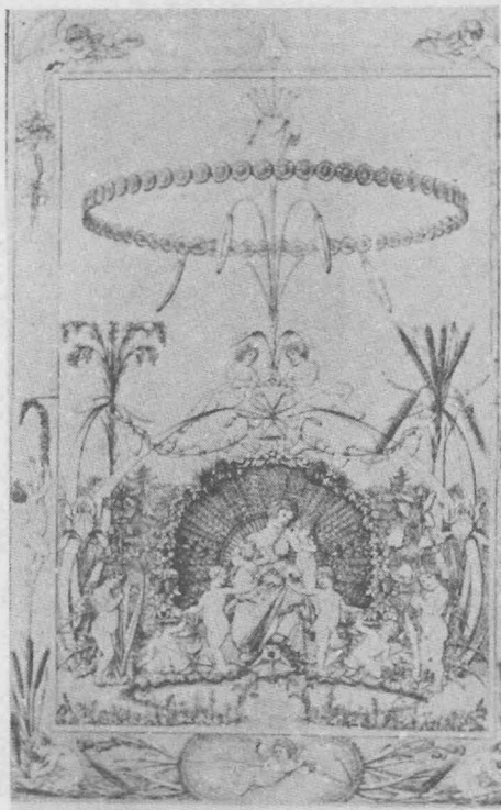
ภาพตอมเที่ยง ค.ศ. 1803