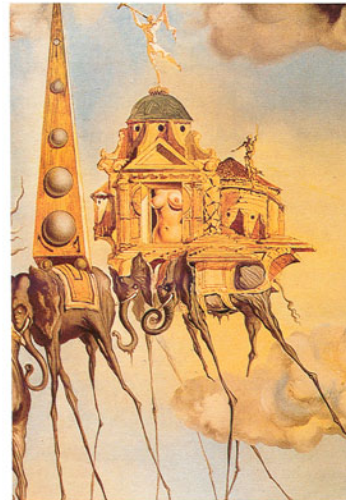
Salvador Dalí : The Temptation of St. Anthony (1946) (detail)