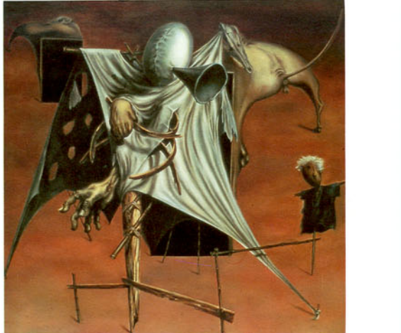
C5 จีระศักดิ์ พัฒนพงศ์ การเดินทางสู่ความฝัน (2524)