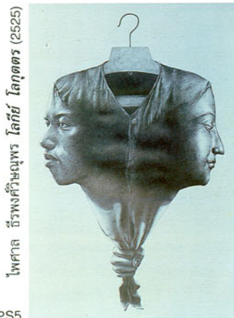
PS5 โฟศาล ชีรพงษ์วิษณุพร โลกีย์ โลกุตตร (2525)

ในบรรดาผลงานที่สะท้อนปัญหาของชาวชนบทที่เข้ามาหางานทำในกรุงเทพฯ โฟศาลวาดภาพเกี่ยวกับหญิงสาวที่จำต้องยึดอาชีพขายตัวไว้มากที่สุดที่โดดเด่นที่สุดในชุดนี้ คือ ถนนสายนี้ชื่อพัฒนาพงศ์ (2525) (PS3) เป็นภาพถนนสายหนึ่งที่ทอดตรงเข้าไปยังประตูที่ตั้งอยู่ตรงหว่างขาของผู้หญิงล้าชาก็เปลือยเปล่าจากน่องถึงเท้ามีลักษณะเป็นรอยเนาเปื่อย ริมถนนชิดกับปลายเท้าชาวามีป้ายชื่อถนนติดอยู่กับเสาเดี่ยวๆ เหนือขึ้นไปมีลักษณะเป็นกระโจมผ้าขาว มีไม้ค้ำยันให้คงรูป ส่วนด้านบนกระโจมเหนือกรอบประตูมีทรวงอกคู่หนึ่งห้อยลงมา เหนือกระโจมผ้ามีหน้ากากโผล่มา 2 หน้า บังหวักระโหลกสุนัข (นายทุน) เอาไว้ นับเป็นการตีแผ่ความเป็นจริงที่สังคมไทยไม่ยอมยกยอมรับอย่างใจแจ้งแจ้ง ด้วยลักษณะที่ทำให้ทลายและนำคืนตระหนกไม่น้อยเมื่อเทียบกับมาตรฐานทางจริยธรรมของไทย