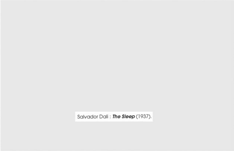
Salvador Dalí : The Sleep (1937).