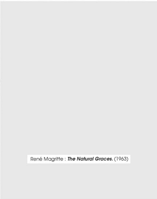
René Magritte : The Natural Graces . (1963)