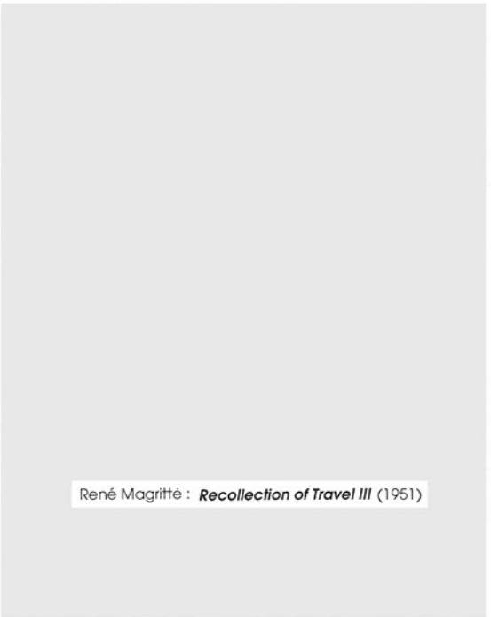
René Magritte : Recollection of Travel III (1951)