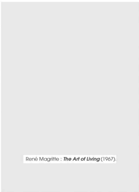
René Magritte : The Art of Living (1967).