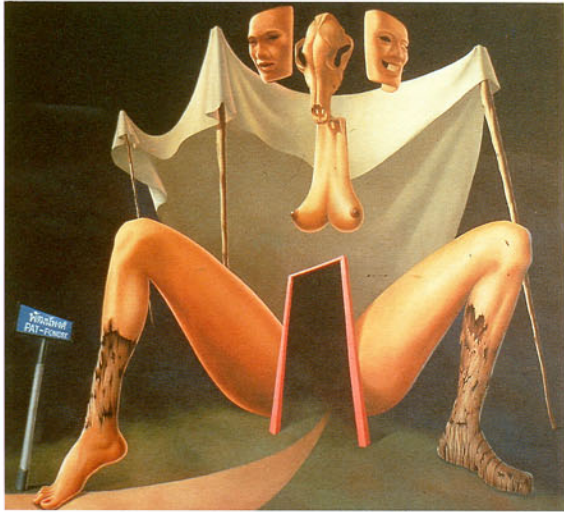
PS3 โฟศาล ชีรพงษ์วิษณุพร ถนนสายนี้ชื่อพัฒนาพงศ์ (2525)