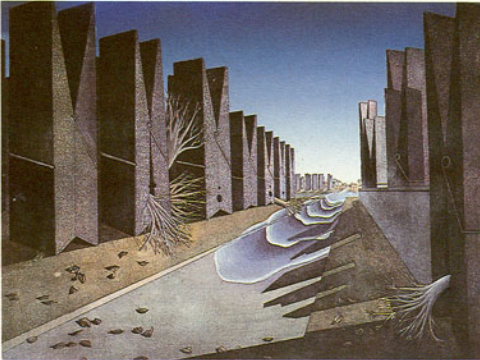
นัยนา ไซดีสุซ ทางออกของจิตที่ถูกกดตัน 3 (2524)

ในภาพ ทางออกของจิตที่ถูกกดตัน 2 (N3) คลื่นและน้ำดูมีพลัง และขอบเขตของการทำลายมากกว่าใน N2 ต้นไม้ใหญ่ยืนต้นตายหรือ เอนล้มระเกะระกะ มีใบไม้ร่วงเกลื่อน ความรู้สึกอึดอัดปวดร้าวและลักษณะ ของความเก๋กุดซึ่งสะท้อนออกมาจากจิตได้สำนึกของศิลปินดูจะรุนแรงยิ่งกว่า ใน N1 และ N2 และไม่มีร่องรอยหรือสัญลักษณ์ที่แสดงถึงโอกาสที่จะมี ชีวิตอยู่ในสภาพแวดล้อมเช่นนี้เลย