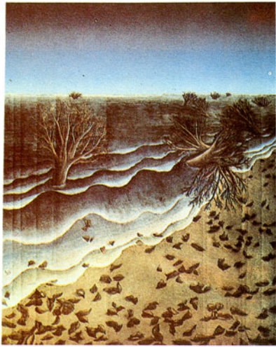
นัยนา ไซดีสุซ ทางออกของจิตที่ถูกกดตัน 2 (2524)