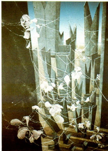
นัยนา ไซดีสุซ ทางออกของจิตที่ถูกกดตัน 4 (2525)

ในภาพ ทางออกของจิตที่ถูกกดตัน 3 (N4) เห็นลักษณะคลื่นที่ ผิดธรรมชาติ ดูแข็ง โหลบามาตามถนนซึ่งขนานด้วยแถวไม้หนึบขนาดใหญ่ ที่เรียงเป็นดับทั้ง 2 ด้าน มีกอวัชพืชแห่ง ๆ แทรกซึมอยู่เป็นบางจุด ส่วนใหญ่ มีลักษณะเหมือนตายแล้ว บนพื้นถนนส่วนหน้ามีใบไม้ร่วงประปรายคล้าย N3 เงาของไม้หนึบมีลักษณะไม่สมจริง มีทั้งเงาที่ทอดยาวลงมาบนถนน และในน้ำ กับเงาที่ซ้อนไปตามแนวไม้หนึบ ฟ้ากำลังจะมืด บรรยากาศ ว่างเวง อ่างว้าง ดูเร้นลับและแทบปราศจากชีวิต