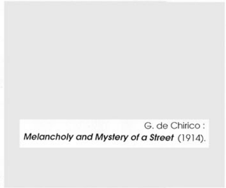
G. de Chirico : Melancholy and Mystery of a Street (1914).

นัยนาดูจะได้รับแรงบันดาลใจจากเดอ คิริโก ในแง่การเสนอภาพที่แฝงคุณค่าเชิงกวีนิพนธ์ไว้ในความเงียบ เร้นลับและอ้างว้าง ตลอดจนการเสนอเวลาที่กำกวมบอกไม่ได้ว่าเช้าสายบ่ายเย็น หรือเวลาที่ขัดแย้งกันในภาพเดียวกัน เช่น ใน N4 มีทั้งเงาที่ทอดบนถนน (เวลาบ่ายมาก) และเงาที่ซ้อนไปตามแนวไม้หนึบ (เวลาเที่ยง) ลักษณะนี้คล้ายกับการเสนอบรรยากาศ เวลาและเงาในจิตรกรรมของเดอคิริโก เช่น Melancholy and Mystery of a Street (1914 -11 )