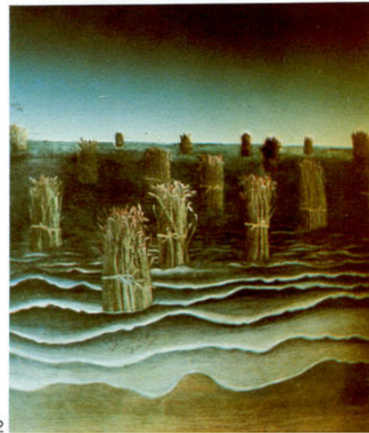
นัยนา โซติสซุช รอคความตาย 2 (2524)