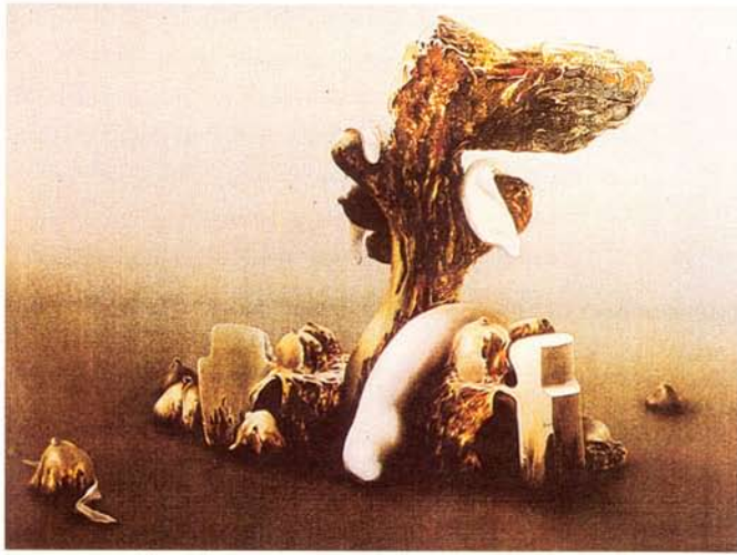
SS1 เสริมศักดิ์ สุขเปี่ยม ความขัดแย้งของรูปทรงต่างสภาพในจินตนาการ 2 (2528)