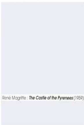
René Magritte : The Castle of the Pyrenees (1959)