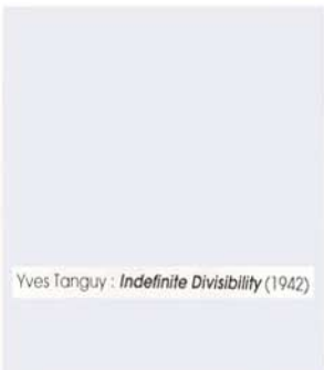
Yves Tanguy : Indefinite Divisibility (1942)