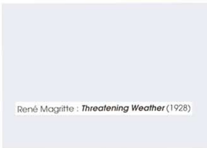
René Magritte : Threatening Weather (1928)