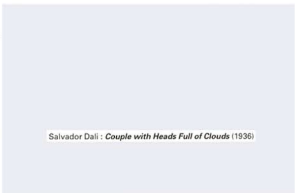
Salvador Dali : Couple with Heads Full of Clouds (1936)

ข้อที่น่าสังเกตอีกประการหนึ่งก็คือ UA1 มีบรรยากาศโครงสีและรายละเอียดของภาพ (เช่น โต๊ะปูผ้า) ชวนให้นึกถึงภาพของดาลีชื่อ Couple with Heads full of Clouds (1936 70 ) ด้วย