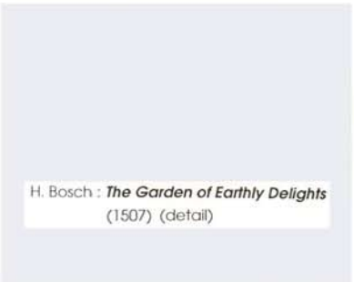
H. Bosch : The Garden of Earthly Delights (1507) (detail)