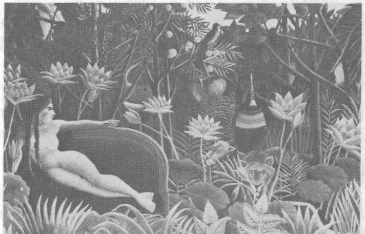
ภาพความฝัน ค.ศ. 1910 ภาพเขียนสีน้ำมัน ขนาด 6'9" x 11'4" ไมเคอร์นอาร์ต นิวยอร์ก

ช่วง 4 ปีท้ายของชีวิต เขาก็ยังคงผลิตผลงานออกมาบ้าง เขาขายภาพได้แต่ไม่เคยร่ำรวย ใน ค.ศ. 1908 และ ค.ศ. 1909 เขาจัดงานราตรีที่มีเสียงเพลงบรรเลงในห้องของเขา มีทั้งเพื่อนบ้าน และเพื่อนศิลปินหัวก้าวหน้ามาร่วมงานอย่างคับคั่ง เขาสิ้นชีวิตลงในปารีส เมื่อวันที่ 4 กันยายน ค.ศ. 1910