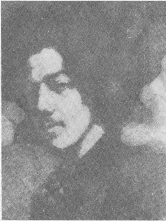
ภาพเขียนตัวเองของวิสท์เลอร์

จิตรกรเชื้อชาติอเมริกันผู้ต่อต้านธรรมเนียมในศิลปะอังกฤษ