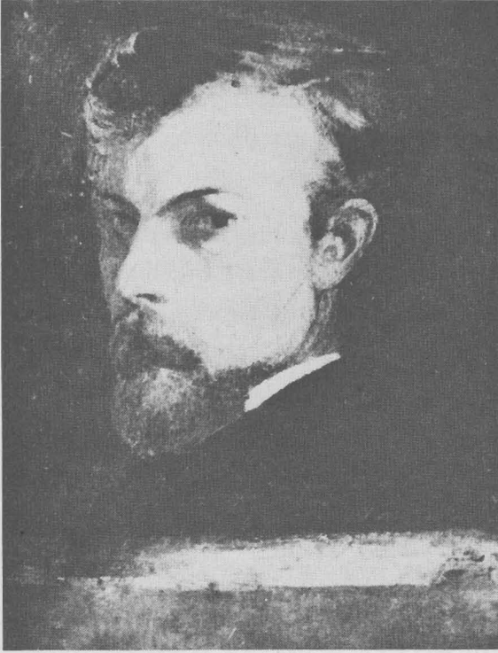
ภาพเขียนตัวเองของเรอดง

จิตรกรซีมบอลิสต์ผู้มีดวงตาเห็นภาพตามจินตนาการ