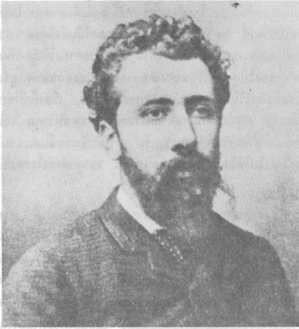
ภาพถ่ายของเซอราท์

จิตรกรนักทฤษฎีผู้สร้างศิลปะนีโอ-อิมเพรสชันนิสต์ตามหลักวิทยาศาสตร์