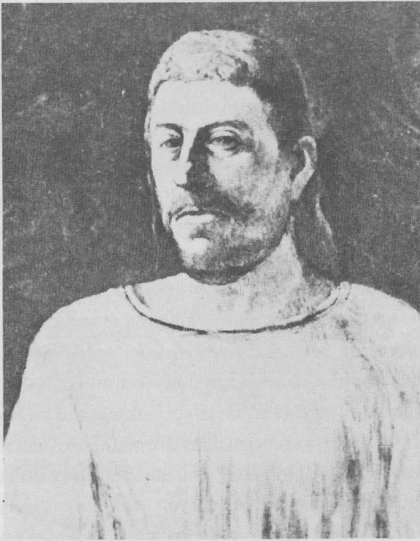
ภาพเขียนตัวเองของโกแก็ง

ผู้นำกลุ่มซิมบอลิสต์คัดค้านการเขียนภาพตามธรรมชาติ