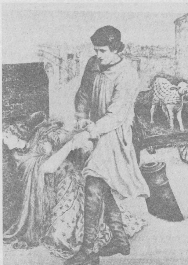
ภาพพบ ค.ศ. 1854 ขนาด 36" × 31½" ศูนย์ศิลปะเลาแวร์

เป็นภาพเขียนฝีมือโรสเช็ตตีชื่อ The Girlhood of Mary Virgin ซึ่งได้น้องสาวผู้เป็นภรรยาของเขาชื่อ คริสติน่าเป็นแบบให้ ภาพนี้ทำตามอุดมคติที่กลุ่มภราดรภาพได้ตกลงกันไว้ว่า จะแสดงออกซึ่งศีลธรรม หรือความคิดเพื่อสังคม โดยมีวิธีเขียนภาพให้เป็นจริงตามแบบที่มีตัวตนอยู่