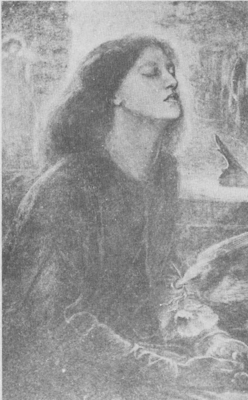
ภาพเบอาตา เบอาตริกซ์ ราว ค.ศ. 1863 ภาพเขียนสีน้ำมัน ขนาด 34" x 26" เทตแกลเลอรี ลอนดอน

ความสัมพันธ์ระหว่างเขากับเอลิซาเบธ ซิตดัล เป็นปัญหาหนักให้ปวดร้าวอยู่เรื่อยมา กว่าจะแต่งงานกันได้ก็ตั้งปี ค.ศ. 1860 แต่แล้วเธอก็มาด่วนกินยาฆ่าตัวตายจากเขาไปในปี ค.ศ. 1862 ทำให้โรสเซตตี ปรีเวทนาถึงเธอเป็นอันมาก ถึงกับฝังบทกวีต่างๆ ลงไปพร้อมกับร่างเธอ แล้วก็เขียนภาพ Beata Beatrix ไว้เป็นอนุสรณ์ถึงเธอ ในระยะนี้เขากลายเป็นจิตรกรผู้มีชื่อเสียงมากขึ้นทุกที แต่ภาพสตรีที่เขาเขียนก็มักจะเป็นหญิงงามคนเดิมที่เขาหลงรักซ้าซากอยู่อย่างนั้น