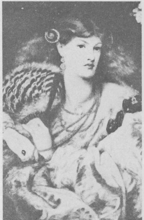
ภาพโมนนา วันนา ค.ศ. 1866 ขนาด 35" x 34" เทตแกลเลอรี ลอนดอน