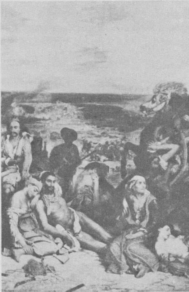
การประหารหมู่ที่คีออส ค.ศ. 1824 ภาพเขียนสีน้ำมัน 166" x 138 1/2" พิพิธภัณฑ์ลูฟร์ ปารีส

เดอลาคัวซ์นำภาพออกแสดงเป็นครั้งแรกในปี ค.ศ. 1822 ภาพ Dante and Virgil Crossing the Styx (ต้นตึกกับเวอร์จิลข้ามฝั่งน้ำไปเมืองนรก) แสดงเรื่องราวที่แปลกแหวกแนวออกไปเพื่อให้เกิดพลังเขย่าขวัญคนดู เขาก้าวต่อไปในการทำงานทำนองนี้ด้วยการแสดงภาพเหตุการณ์โหดร้ายทารุณที่เกิดขึ้นในเวลานั้นและกำลังเป็นที่โจษจันกันทั่วไป ในภาพ The Massacre at Chios (การประหารหมู่ที่คีออส) ซึ่งปรากฏในงานแสดงศิลปกรรมประจำปี ค.ศ. 1824 นั้น มีรูปแบบทางศิลปะที่แสดงอิทธิพลของโกรซ์เช่นเดียวกับของคอนสแตนติน ซึ่งมีภาพ Hay Wain (เกวียนบรรทุกหญ้า) แสดงอยู่ในงานเดียวกันนั่นเอง มีอยู่พักหนึ่งที่เดอลาคัวซ์สนใจศิลปะและวรรณคดีอังกฤษมาก โดยเฉพาะอย่างยิ่งของเชคสเปียร์ สกอตต์และไบรอน เขามีความสัมพันธ์อันดีกับจิตรกรสีน้ำชื่อ โบนิงตัน และได้ไปพำนักด้วยที่อังกฤษในฤดูร้อนปี ค.ศ. 1825