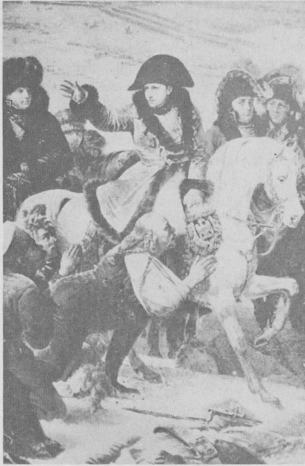
ภาพนโปเลียนในสนามรบที่เอโด (บางส่วน) พิพิธภัณฑ์ลูฟวร์ ปารีส ราว ค.ศ. 1806

หลังจากที่นโปเลียนหมดอำนาจลงในปี ค.ศ. 1815 โกรซก็เปลี่ยนไปทำงานให้กับราชวงศ์บูร์บอง แต่เมื่อขาดแรงบันดาลใจที่เคยได้รับในสมัยของนโปเลียน ภาพเขียนของเขาก็ตกต่ำลงในเวลาไม่นาน ดาวิซึ่งขณะนั้นลี้ภัยอยู่ต่างประเทศได้ขอให้โกรซรับช่วงสอนศิษย์ของเขาต่อไป โดยหวังว่าโกรซจะช่วยป้องกันศิลปะนีโอคลาสสิกไว้ได้จากศิลปะโรแมนติกที่กำลังแพร่หลายมากขึ้นทุกที (ซึ่งความจริงแล้ว โกรซดูเหมือนจะมีจิตใจเอนเอียงไปทางศิลปะแบบใหม่มากกว่า) งานจิตรกรรมชิ้นหลัง ๆ ของเขาถ้าไม่นับภาพเหมือนแล้ว ก็ล้วนแต่เป็นภาพในเทพนิยายและภาพพิธีศพทั้งสิ้น ซึ่งก็รวมทั้งภาพขนาดมหึมาชื่อ Apotheosis of the Bourbons (เดิมชื่อ Apotheosis of Napoleon เมื่อได้รับว่าจ้างให้ทำในปี ค.ศ. 1811) ภาพนี้อยู่ที่วิหาร Pantheon ในปารีส โกรซได้รับฐานันดรศักดิ์จากพระเจ้าชาร์ลส์ที่ 10 ในปี ค.ศ. 1825 สำหรับภาพที่เขาเขียนนี้ แต่ชีวิตในปีท้าย ๆ ของเขานั้นน่าเศร้า เขาทนต่อคำวิพากษ์วิจารณ์โจมตีไม่ไหว ประกอบกับความล้มเหลวในชีวิตสมรส ในที่สุดเขาก็ดำดิ่งลงในแม่น้ำแซนดับชีวิตลงด้วยตนเองในปี ค.ศ. 1835