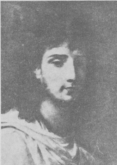
ภาพเขียนตัวเองของโกรซ