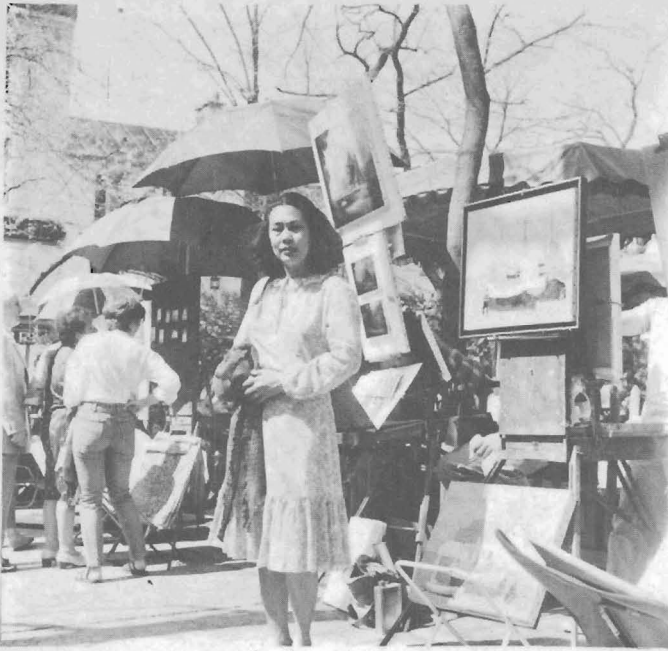
ม่งต์มาร์ต เมษายน 2527