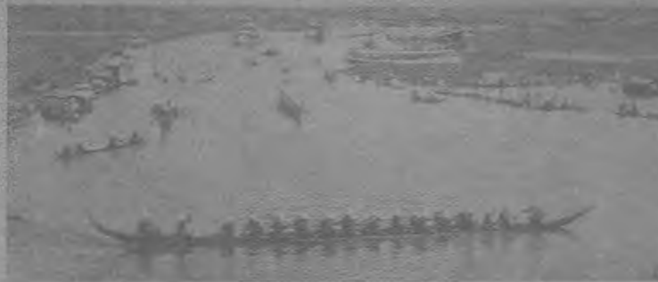
CHAO PHRAYA RIVER