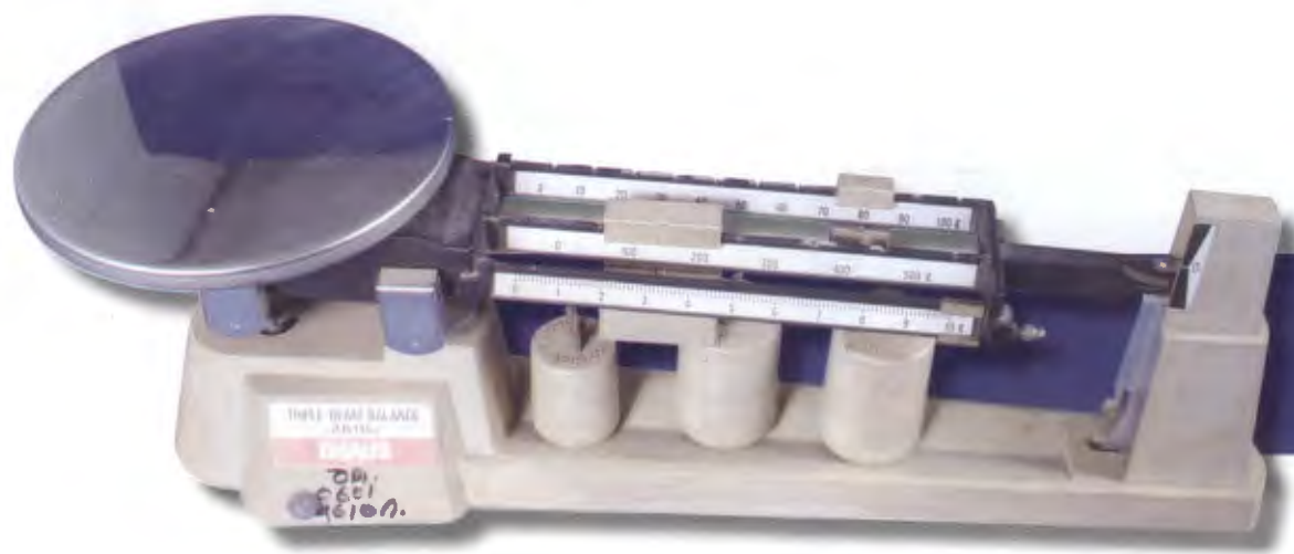
๒๖. เครื่องชั่ง