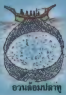
อวนล้อมปลา