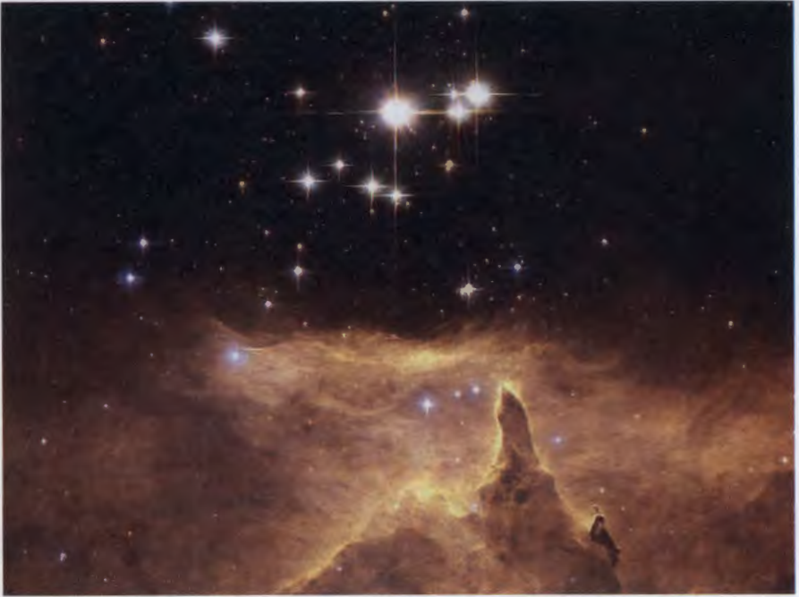
"แม่ธรรมชาติ" - ชีวิตก่อเกิดจากภาพธรรมชาติโบราณคดี....แต่ชีวิตดำรงอยู่เพื่ออะไร?